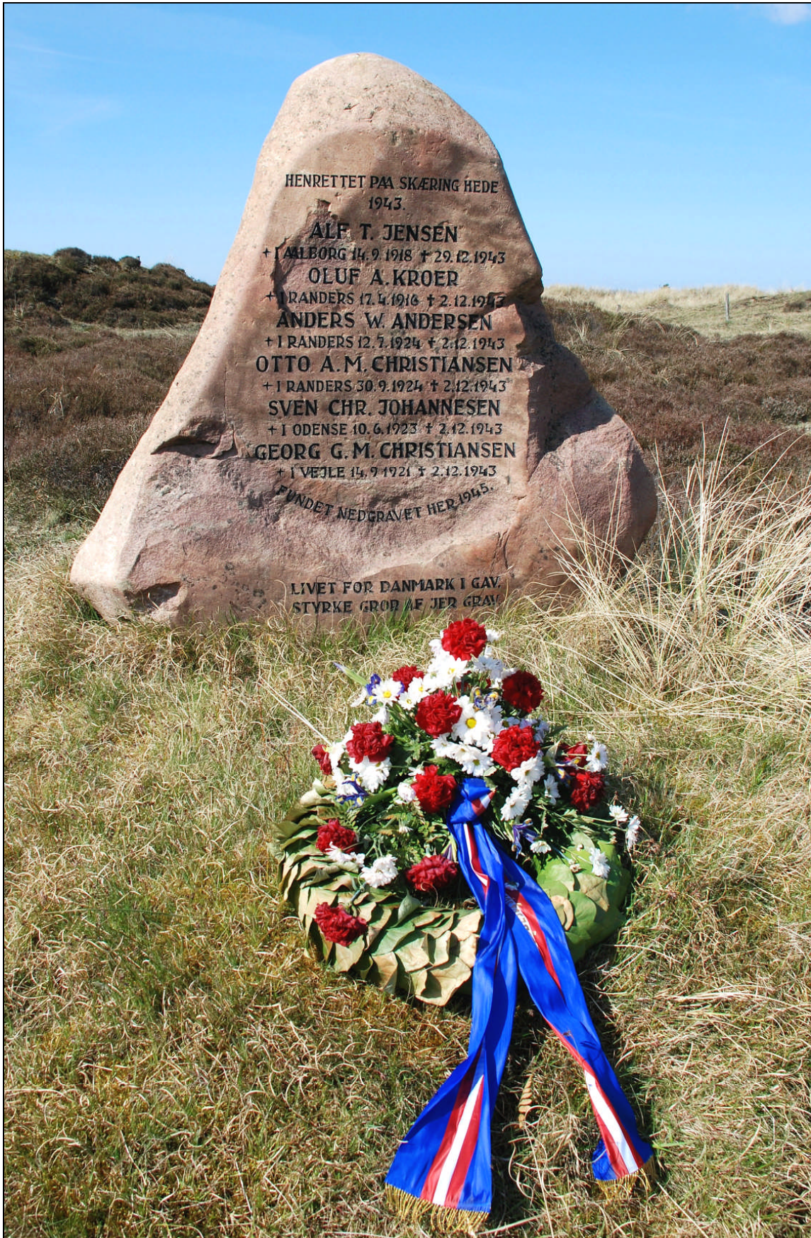
Frihedskæmpernes mindesten – Husbjerg Klit, den 4. maj 2008.