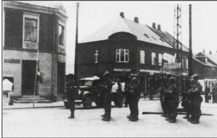
Brigadens æresdeling i Oksbøl aflægger honnør. Frihedskæmpernes kister føres til hjembyen.

Tirsdag den 22. maj blev de tre af kisterne ført til Randers, hvor de blev stillet i hospitalskirkens kapel. Den 25. maj blev de tre frihedskæmpere begravet fra Sct. Mortens kirke. Kisterne førtes ud til Nordre Kirkegård fulgt af en tusindtallig skare. På den måde blev det en værdig måde, hvorpå familierne kom til at opleve at sige farvel til deres sønner. Randers by havde givet den smukkeste gravplads i Danmark, en mindelund, der er byen værdig.