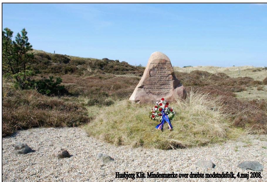
Husbjerg Klit. Mindesmærke over dræbte modstandsfolk, 4.maj 2008.