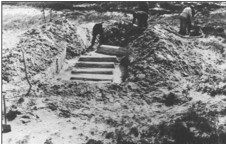
De medtagne kister afdækket. Vandet i graven pumpes væk, før kisterne tages op.

Kisterne havde numre fra 1 – 6. Kisten længst borte en anbragt skråt i forhold til de andre. Dette blev opfattet således, at myndigheder mente at kunne fastslå, at der var tale om en senere begravelse.