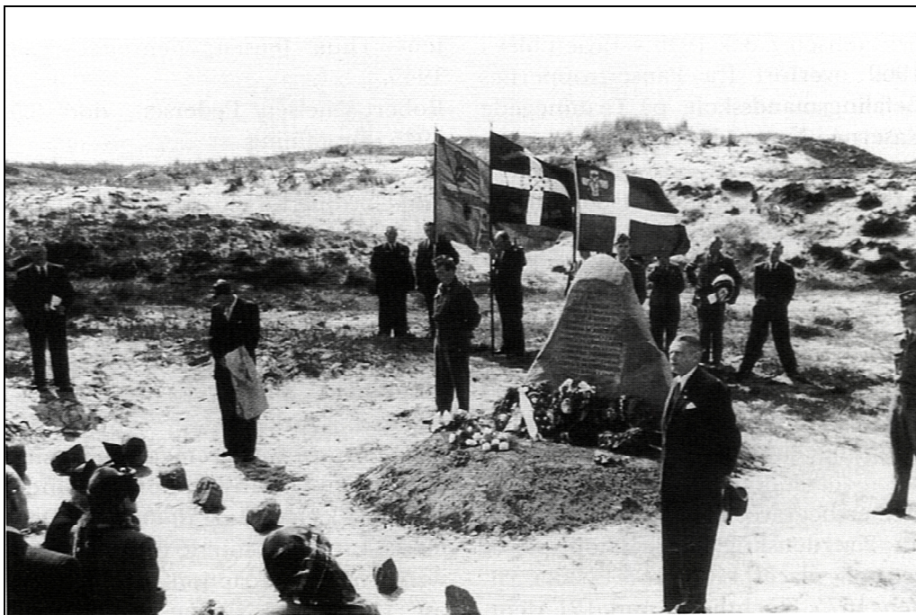
Husbjerg Klit – Mindestenen for de 6 henrettede fra Randers og Århus. Afsløring den 5. maj 1952.