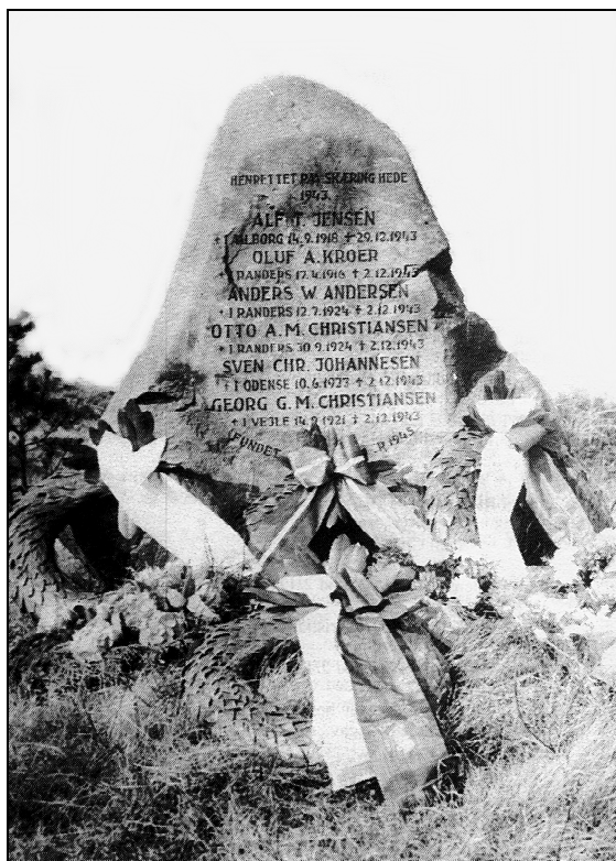
Mindestenen ved afsløringen, maj 1952.