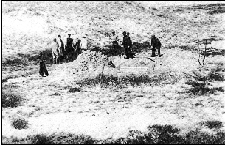
Husbjerg Klit – de begravede sabotørers seks kister bliver afdækket i maj 1945.